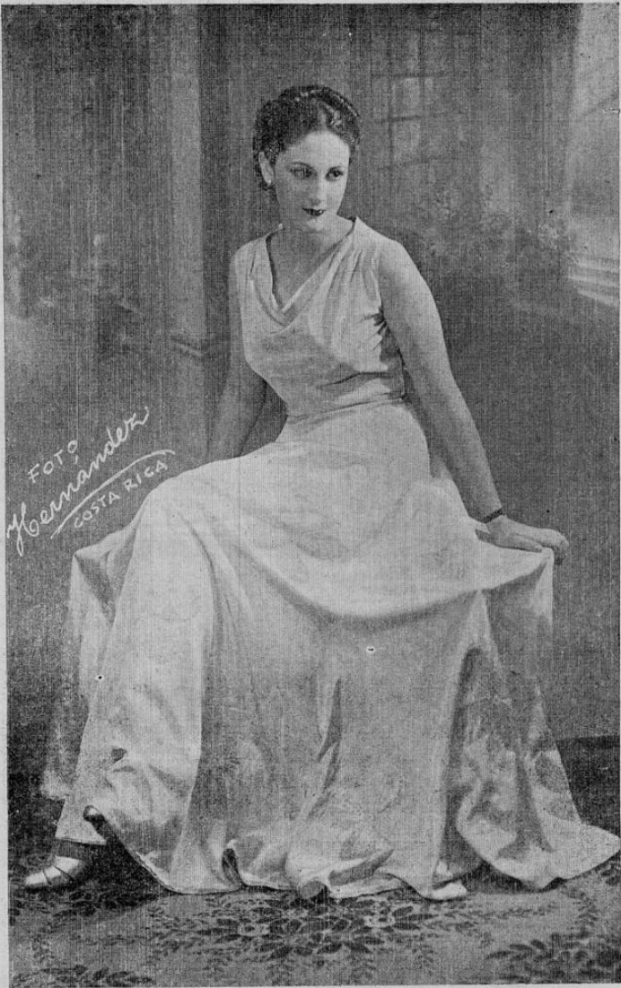
COSTA RICA

Con los moros regulares cerca de BRUNETE, 30.—Dos de los cuatro tanques rusos que participaron en el formidable ataque gobiernista contra Villanueva de la Cañada fueron puestos fuera de combate por los cañones anti tanques. Además los moros emplearon en esta batalla una nueva granada de mano que resultó sumamente efectiva para romper las formaciones atacantes a considerable distancia. Esta bomba de mano está amarrada en un cable el que a su vez está fijado en un mango de unas doce pulgadas de largo. Esta combinación permite al experto tirador, de las bombas alcanzar una distancia mucho mayor que con la bomba que se tira con la mano. La lucha fué sumamente sangrienta y los moros se defendieron con un imprevisto heroísmo, siendo altamente indiferentes en cuanto a la suerte que ellos mismos corrieran. Poco a poco los gobiernistas fueron flanqueados por ambas alas y esta mañana la espantosa carnicería todavía continuaba en algunos sectores.