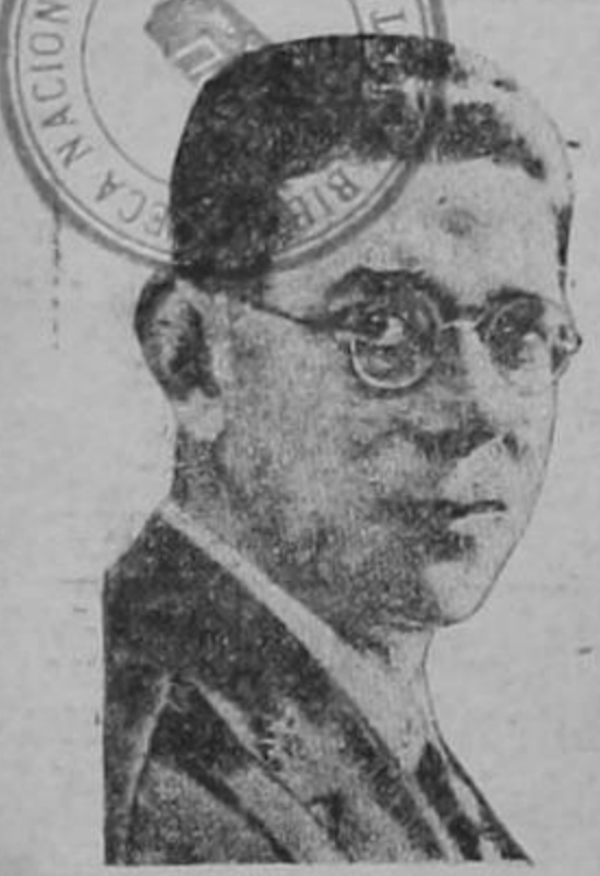
GIBRALTAR, 9. — UP. — (Por Michael McEwen). — España nacionalista celebró anoche la captura del puerto de Málaga con grandes manifestaciones de júbilo. Aun el general de división Emilio Mola, uno de los más destacados líderes

tes Málaga nació de nuevo a la civilización. Trescientos prisioneros fueron rescatados de la barbarie marxista justamente en el momento cuando iban ser fusilados. Hemos capturado piezas de artillería de los rojos y varios de sus barcos de guerra".