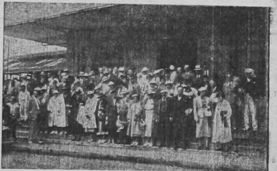
La foto recoge la llegada del último grupo de turistas norteamericanos a esta capital. Al pleno medio día, la cámara de Castillo captó los plácidos rostros de los viajeros.

En ediciones sucesivas nos ocuparemos del mencionado informe que es muy interesante.