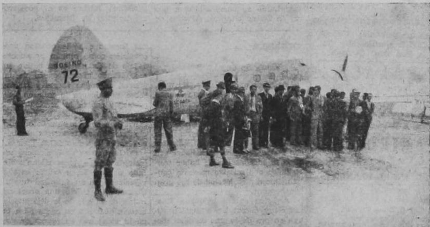
Con el avión de la "Scadta" y las ondulaciones suavísimas de los cerros circundantes al fondo, la delegación deportiva costarricense posó para NOVEDADES en el aeropuerto de Medellín.

ron los puños y quebraron la norma ancestral de la hospitalidad colombiana en el estadio municipal de Barranquilla, pone de la actitud caballerosa de los seis mil antioqueños que presenciaron el encuentro del domingo desde las tribunas del hipódromo de los Libertadores.