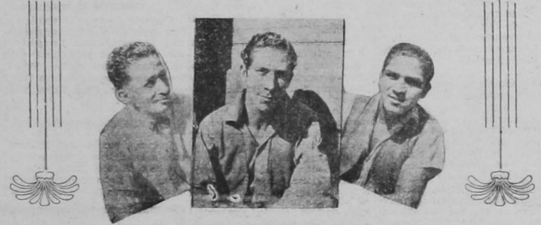
(ARAYITA, BLANCO NEGRO, ESCALANTE (EL SECRE))

Este no es diferente a los demás. El día que faltan todos los empleados por esas causas frecuentes tan periclitadas, es cuando sale más temprano y con más buena lectura y con mejores noticias. Pero veamos en qué consiste este personal. El General Pinaud anda diciendo por allí que el dueño. Posiblemente si esto lo llevamos ante la Liga de Naciones o ante el Chief Justice de los Estados Unidos, presione que le den la razón. Pero en realidad el General es apenas el dueño psicológico. No lo dejamos meterse mucho por esta casa. El hombre puntual, sistemático y metódico. Y nosotros salimos a la hora que nos da la gana y sin sistema de ninguna clase. El día que se nos antoja tomamos la sirena y nos vamos a las nueve de la mañana. Aborotamos la ciudad y nos metemos por todos lados con el texto de que hemos recibido la noticia de esas que nos sirven mediante pago naturalmente, United Press. Y quiera o no quiera el general Pinaud nos vamos a la calle. Otros días lo hacemos a las once, es decir, a la hora del aperitivo, a ver salir a las empleaditas de sus oficinas y oficinas. Y si no a la hora de la fuerza. Pero eso sí, antes que los demás. La dejaremos no la dejamos quitar nunca. Cuando el General Pinaud piensa que vamos haciendo NOVEDADES encuentra con ella por la calle de modo, pues, que nosotros no