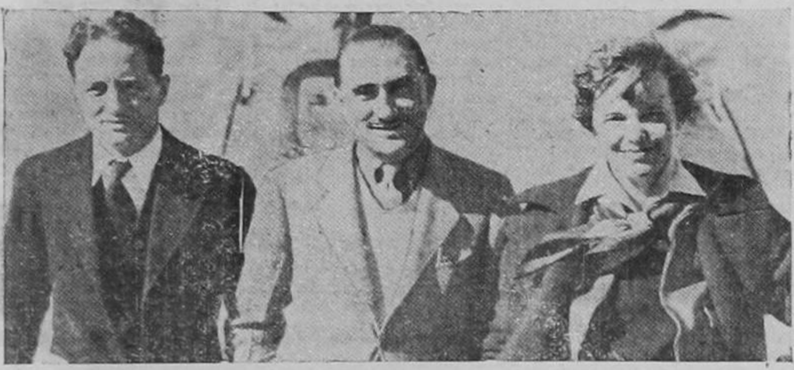
Amelia Earhart aparece en esta fotografía con el Capitán Harry Manning y Paul Mantz en Oakland en la costa del Pacífico momentos antes de que partiera con Manning en su travesía del territorio americano que fué una prueba de su avión de dotación perfecta al cual se da el nombre de "laboratorio volante". Manning la va a acompañar en parte de su vuelo de 27.000 millas alrededor del mundo, vuelo de que en forma exclusiva informó LA TRIBUNA.