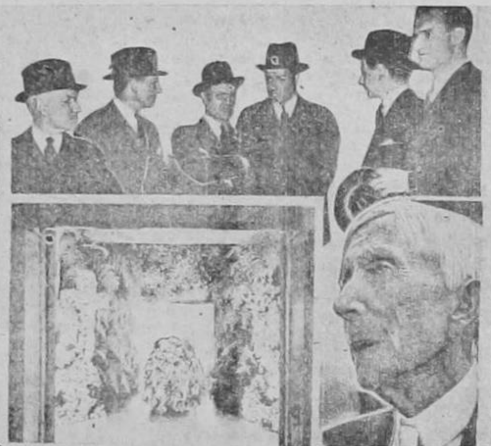
Arriba: los herederos del multimillonario Rockefeller; el féretro en la capilla ardiente sin más adornos que helechos; y la última fotografía a los 98 años.