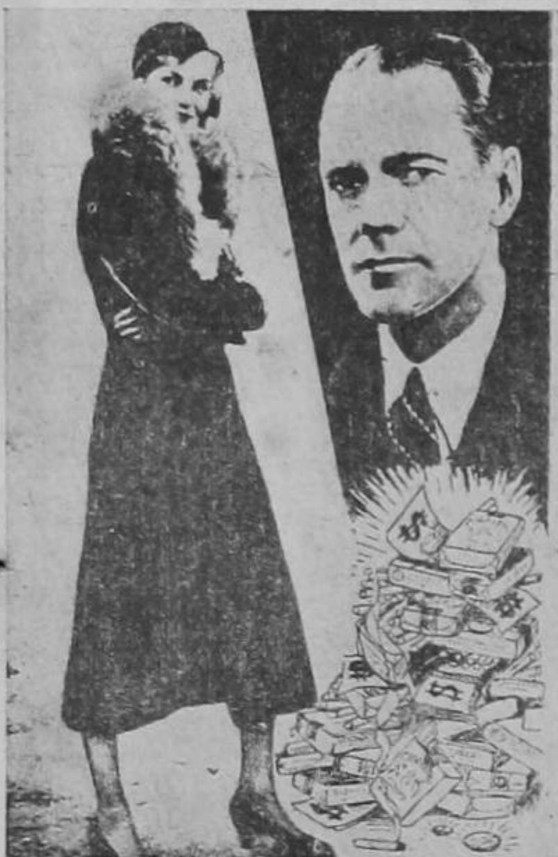
Esta es Doris Duke, la mujer más rica del mundo, heredera de la fortuna hecha por su padre en cigarrillos que contrajo matrimonio con James Cromwell casado antes con otra millonaria.

OPINAN LOS EXPERTOS MILITARES QUE LOS ROJOS HAN PERDIDO TODA POSIBILIDAD DE TRIUNFO CON EL FRACASO DE LA OFENSIVA DE MIAJA PARA LEVANTAR EL CERCO DE MADRID