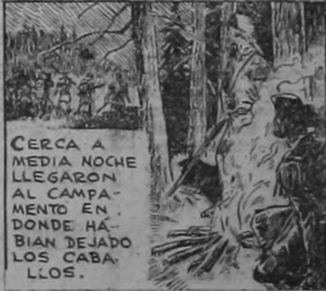
CERCA A MEDIA NOCHE LLEGARON AL CAMPAMENTO EN DONDE HABIAN DEJADO LOS CABALLOS.