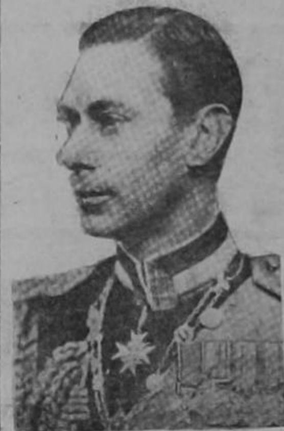
S. M. el Rey Jorge VI de la Gran Bretaña