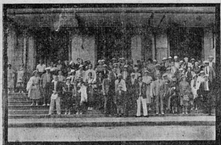
La gráfica recoge a los integrantes del grupo de turistas que en vapores de la United Fruit Company arribaron el sábado de la mañana a Limón, trasladándose inmediatamente a esta capital donde permanecerán hasta el domingo a medio día en que regresarán a nuestro puerto del Atlántico, para tomar los barcos y continuar la gira por los países del Caribe.