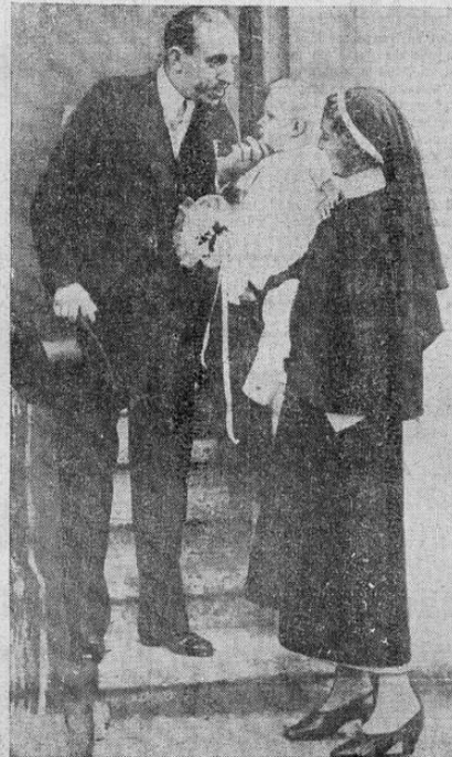
Monarcas en activo y en pasivo, así como sus reinas, se encontraban presentes entre los asistentes a la boda de la princesa Dolores de Orleans-Borbón, sobrina del ex rey Alfonso de España, y el príncipe Augusto de Polonia. En esta foto aparece el ex rey Alfonso, acariciando a una de sus nietas.