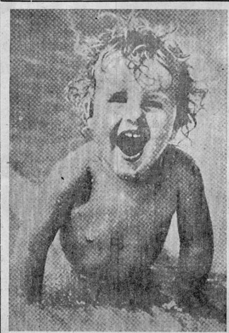
"Hacer patria es hacer ciudadanos útiles a ella"

muchos lugares en que apenas cuenta un médico para cada