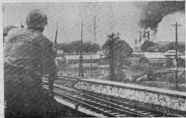
Un soldado de infantería de los japoneses, observó como las llamas terminan su trabajo de destrucción en uno de los edificios de la Nankai-Universiy de Tientsin, tras de haber sido alcanzado repetidamente por la metralla de la artillería y las bombas de los aviones, antes de la ocupación de la ciudad por el ejército nipón.