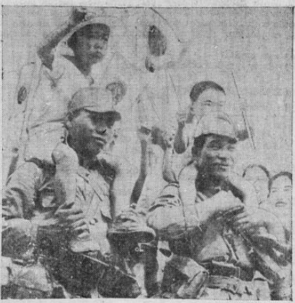
Desde tiempos inmemoriales, el soldado que va a la guerra es un héroe popular. Aquí se ve a dos soldados japoneses, que des cansan en una aldea china, haciendo de héroes de las mujeres y los niños del lugar.