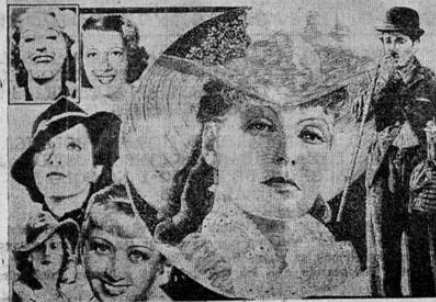
Arriba, cuadro de los 19 héroes de la taquilla. Abajo, siete de los que más fama y paz que no producen tanto dinero como los 12. Ellos son Lily Pons, Grace Moore, Kay Francis, Mae West, Marlene Dietrich, Greta Garbo y Charlie Chaplin.