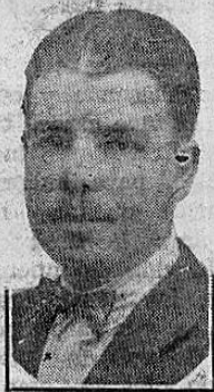
Diputado VOLIO MATA

—El partido republicano nacional no tiene en mira hacer política partidarista en lo que se refiere a las elecciones municipales. Simplemente desea dar a la comunidad un gobierno local integrado por elementos de valer, competencia y perfecta responsabilidad moral, con presidencia absoluta de todo tinte político, de manera que si los caballeros de la