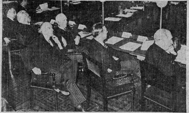
Estos señores solemnes, representantes de nueve importantes naciones del mundo se reunieron en Bruselas, tratando de encontrarle solución aceptable a la cuestión chino-japonesa, pero no llegaron a nada concreto. Así lo han informado los despachos cablegráficos de la United Press, exclusivos para LA TRIBUNA y NOVEDADES

LONDRES, 1º — UP. — La respuesta del gobierno de Barcelona a la nota del Comité de no intervención enviado por la Gran Bretaña fue entregado en la Foreign Office esta mañana. La nota acepta la propuesta de enviar comisiones neutrales a España para efectuar las investigaciones necesarias para el retiro de los voluntarios extranjeros de los ejércitos opuestos, pero hace ver que no es necesario hacer ver la absoluta necesidad de que estas comisiones estén compuestas de personalidades absolutamente neutrales y del agrado del gobierno republicano. Igual a la nota del gobierno del general Franco, Barcelona pide ciertas aclaraciones respecto de algunas cuestiones donde encuentra contradicciones entre el plan británico original del catorce de julio y los puntos del plan británico incorporados en el proyecto de la resolución del comité de no intervención. También acepta la nota las propuestas para reforzar el control en las fronteras y costadas españolas, siendo entendido que se llegará a un entendimiento definitivo respecto del retiro de los voluntarios. El gobierno de Barcelona hace ciertas observaciones acerca de la concesión de los derechos de belligerancia a las dos facciones, haciendo ver que el control sobre esta fase del convenio obviamente no depende de la decisión del gobierno republicano español, sino de la actitud de las potencias fuera de España.