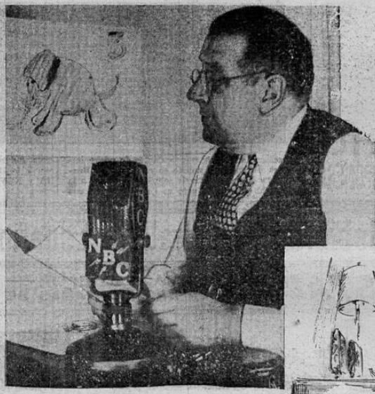
Hendrik William Van Loom en su estudio de la National Broadcasting Company, decorado con sus "monos", dirigiéndose al gran auditorio invisible. En el ángulo, una caricatura del gran historiador y artista.