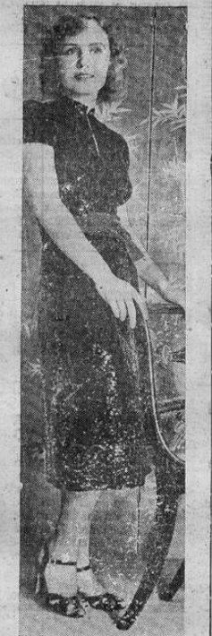
Este modelo, muy propio para la hora del cóctel, es usado por Magde Evans, de los films. Está adornado con lentejuelas negras, las mangas son cortas y abombachadas, la línea del cuello alta y la falda hasta debajo de la rodilla. El cinturón es escarlata y las sandalias de "suede" negro y liso.

carro que iba a marcha regular volcó en una curva y cuando se dio cuenta del suceso vino se bajo la carrocería del vehículo. El tráfico investiga para sentir responsabilidades. Tiene la impresión de que el accidente provino por mala conducción de los breques del carro.