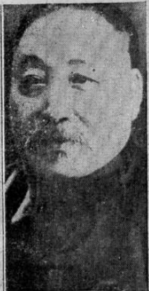
Kao Lin-wei, nuevo gobernador chino de la provincia de Hopei, designado por los japoneses que ocupan el mencionado territorio.

PAGO PAGO, Samoa, 13. UP.— El barremina "Avocet" fondeó en este puerto trayendo a bordo los restos del gran hidroavión "Samoan Clipper" de la Panamerican Airways, el cual se hundió a unas 14 millas de esta bahía mientras trataba de acuatizar y efectuar reparaciones en uno de los motores en el que se había declarado un serio desperfecto. El tamaño de los restos del naufragio como también los pedacitos reducidos de los uniformes de los tripulantes que en él viajaban, indican a las claras que el gigantesco aparato fué destruido por una explosión en medio aire, la que probablemente se produjo por una chispa eléctrica del motor maledado que incendió a la gasolina que el capitán Musiek estaba vaciando en los momentos en que se produjo la catástrofe a fin de acuatizar en condiciones normales de vuelo. No se ha encontrado uno solo de los cadáveres de los siete aviadores que dirigían al hidroavión en su vuelo hacia Nueva Zelandia, y los expertos opinan que probablemente jamás se encontrarán, ya que las indicaciones son que la violencia de la explosión hizo astillarse la obra muerta del Clipper.