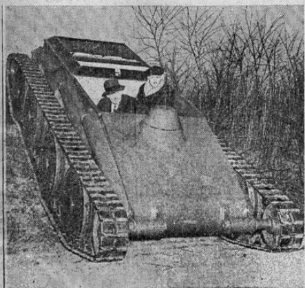
El nuevo tanque de gran velocidad, perfeccionado por Walter Christie, siendo probado en Westfield, estado de Nueva Jersey. Puede hacer 50 millas por hora sobre cualquier terreno, y avanza lo mismo hacia atrás que hacia adelante.