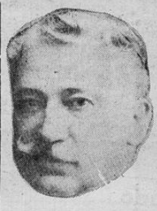
Don JULIO ACOSTA

El ex - presidente Acosta es la figura política excelsa del día. Da relieve a su meritisima personalidad, la altivez patriótica de su gesto al permitir, de muy buena voluntad, encabezar con su prestigiado nombre la papalota de candidatos a diputados del partido INDEPENDIENTE NACIONAL. Vimos esta mañana a don Julio en la Avenida Central. Rodeado por amigos, simpatizadores y partidarios, él recibía efusivas felicitaciones por el merecido alto honor de que ha sido objeto y contestando a esas manifestaciones de cariño, aprecio y confianza, decía: