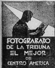
FOTOGRAFADO DE LA TRIBUNA EL MEJOR DE CENTRO AMERICA