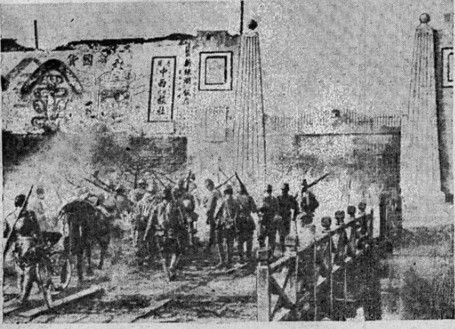
Estas tropas japonesas están cruzando un puente que ha sido incendiado por los chinos en su retirada, situado a las puertas de Tanyang, China del Norte.