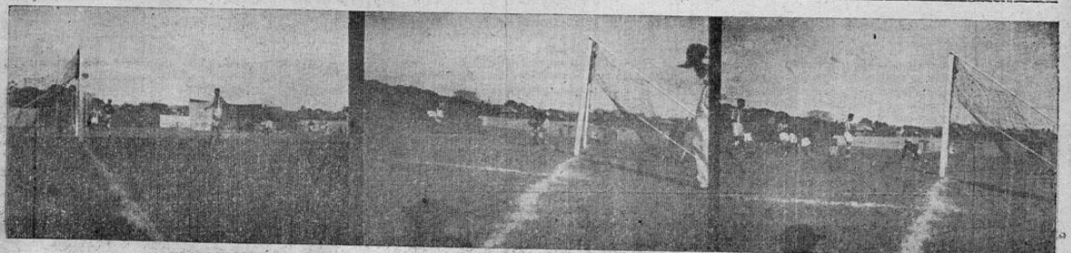
El arquero salvadoreño no pudo detener uno de los siete de los ticos otra anotación de los ticos; y luego otra hasta completar 7