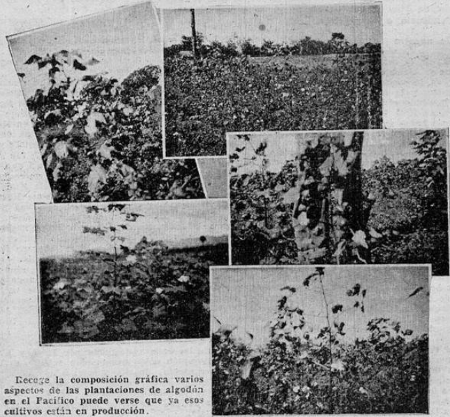
Recoge la composición gráfica varios aspectos de las plantaciones de algodón en el Pacífico puede verse que ya esos cultivos están en producción.