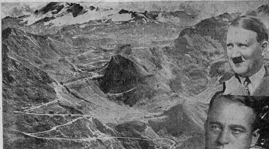
Muestra la foto un magnífico paisaje de la región fronteriza entre Alemania, Austria e Italia, con la magnífica carretera del pico del Grossglockner en el fondo, una de las puertas de entrada a Austria y que pudiera ser utilizada por las tropas alemanas, caso de exigirlo las circunstancias de los actuales acontecimientos políticos. A la izquierda vemos los personajes centrales del juego de ajedrez que está desarrollándose en el tablero de la Europa central. El "Fuehrer" que mediante su política de penetración busca el "Anschluss" definitivo con Austria, Joseph Buerkel, alto comisario de la cuenca del Sarre, quien llegó ayer a Viena como portador del ultimátum alemán. Mussolini, cuyo canciller anunció anoche que Italia se mantendría neutral frente a la crisis en Austria, y el canciller Kurt Schuschnigg, quien, renunció su puesto en la tarde de ayer.

DISUELTO EL FRENTE DE VIENA, 12. (FLAS) de esta capital anunció el ex-canciller Schuschnigg, y política durante los años