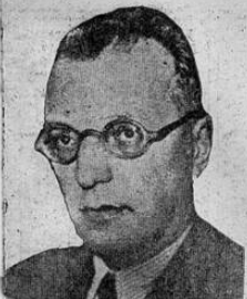
Franz - Inquart, ex - ministro del exterior, quien fué nombrado ayer canciller de Austria,