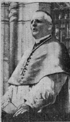
Monsiñer Gerlier que ha sido nombrado Cardenal en el Consistorio Secreto, presidido por el Papa Pío XI. Cinco nuevos cardenales, han sido elegidos, tres italianos, un inglés y un francés. En la Sala de las Bendiciones del Vaticano recibieron el Sombrero Rojo, Símbolo de su rango.