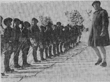
El General Doyen pasando revista a una compañía de cazadores alpinos.

ta horas; mientras que los autopostales de Correos duran cinco horas contadas para el traslado de la correspondencia de Santa Ana a San José cubriendo una distancia cuando más de diez kilómetros. La de San Francisco a Costa Rica es de unos dos mil kilómetros. Y así todo, en correos. Felicito a NOVEDADES por esa campaña de bien público.