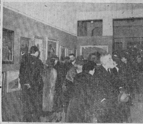
La Exposición artística de Médicos. Se ha celebrado en Panamá una Exposición, donde los cuadros y otras obras de arte, son debidas a médicos, oculistas, dentistas, etc.

ciará Hitler en Viena al medio día del nueve de abril, según se informó en los círculos políticos, puesto que en el Führer hará importantes declaraciones sobre las decisiones tomadas acerca de la anexión definitiva de Austria al Reich. Se cree que el día nueve de abril será conocido en el futuro como el "Tag, Deutschert Einheits" o sea el día de la unidad alemana, y que se celebrará todos los años como día de fiestas.