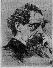
do un favorito perenne, tanto de la escena como de la pantalla cinematográfica.

Durante los últimos cien años, las novelas de Carlos Dickens han disfrutado de una venta fenomenal. Solamente han logrado aventajarse las obras de Shakespeare y la Biblia. Y Dickens ha si-