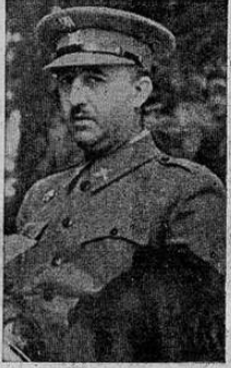
(Pasa a la Pág. OCHO)

HENDAYA, 30. TOS. — En estos días de grandes operaciones militares el generalísimo Francisco Franco duplica, y después de inspeccionar las fuerzas que forman el ala izquierda del vasto ejército que invade Cataluña en tres columnas principales con el objetivo de converger sobre Lérida para capturar esta importante posición llave de las defensas republicanas. Las tropas del general Moscardó están consolidando sus posiciones en el sector de Monzón, avanzando paulatinamente hacia el sur en ambas riberas del río Cinca, y el cuerpo marroquí y los legionarios del tercio bajo el mando del general Aranda han establecido fuertes posiciones en la Sierra de San Marcos, en la vecindad de Morella. La columna del general García Va-