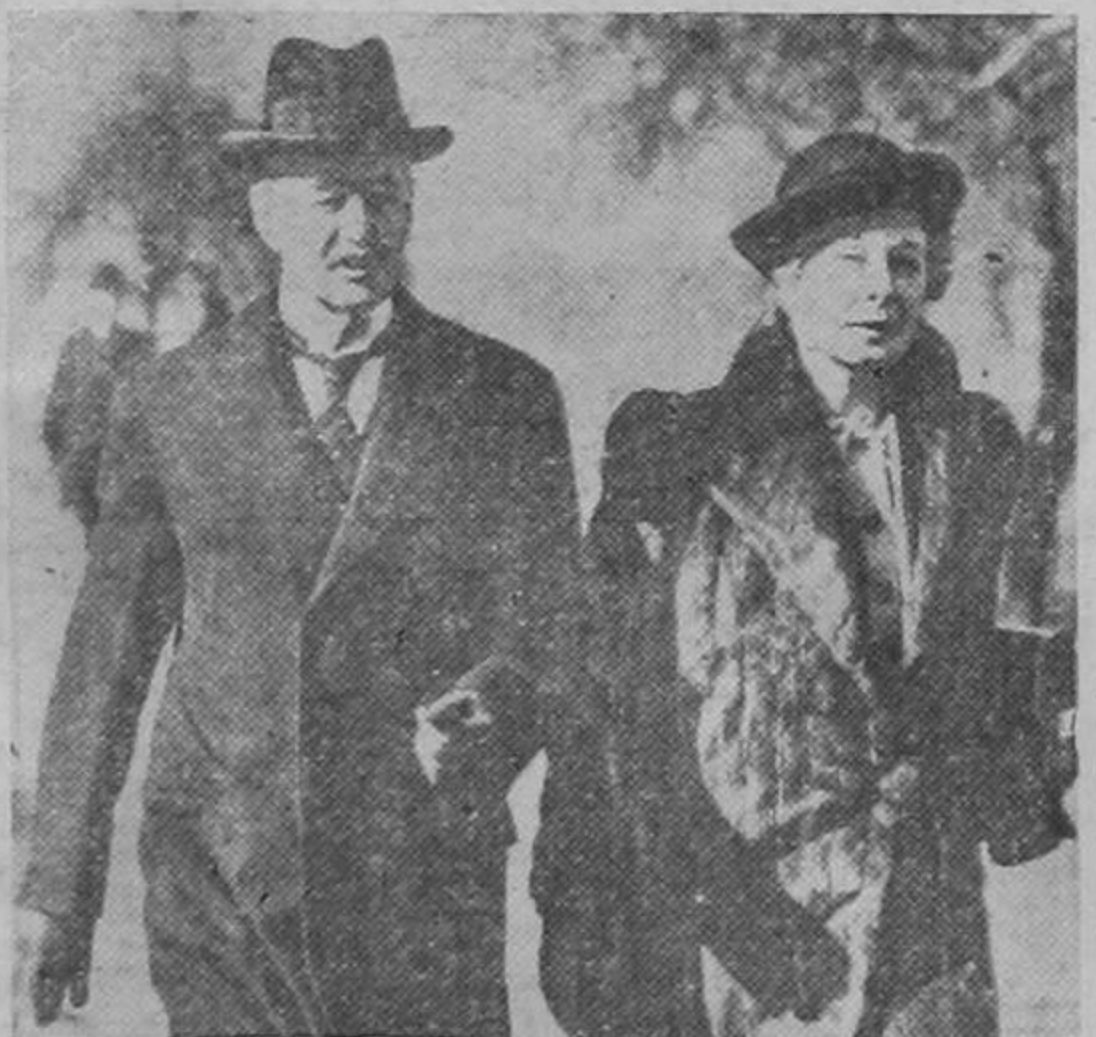
Una reciente fotografía de Neville Chamberlain paseando por las calles de Londres con su esposa, a quien se atribuye también gran influencia en los negocios políticos e internacionales del gobierno.