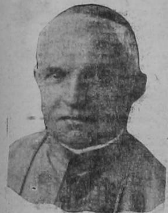
Excmo. Dr. don LUIS DOROU

(VIENE de la Pág. UNO)— gón, y la región al norte de Teruel después de la batalla del río Alfambra. Los despachos del nuevo frente activo indican que las tropas progresan satisfactoriamente. Se trata en primera línea de reducir esta 'bolsa' para enderezar la línea nacionalista a fin de recortar el frente de Levante hasta donde sea posible y para dar a los ejércitos del general Franco una mayor cohesión entre los varios grupos de ejército que participan en la campaña al sur del río Ebro.