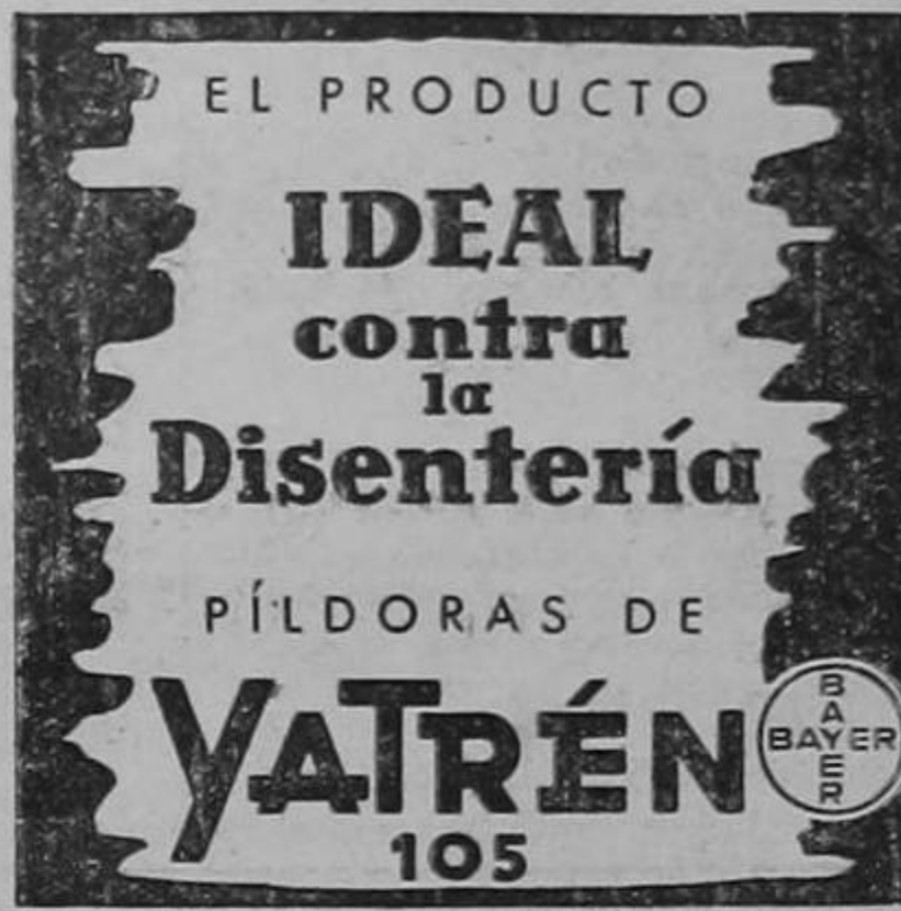
Cada pildora lleva estampada la Cruz Bayer.