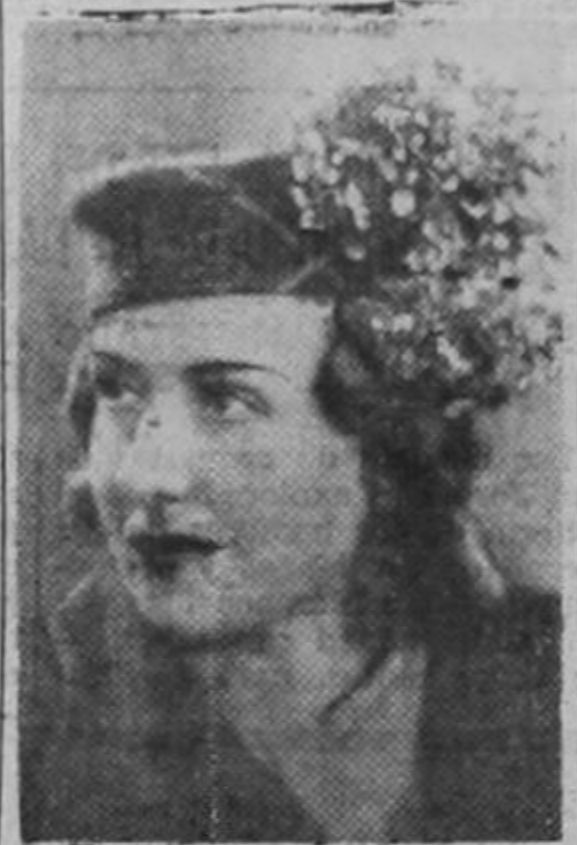
"Bouquet" un bonito fieltro en tejido escosés, creación de la casa Louise Bourbon de Paris.