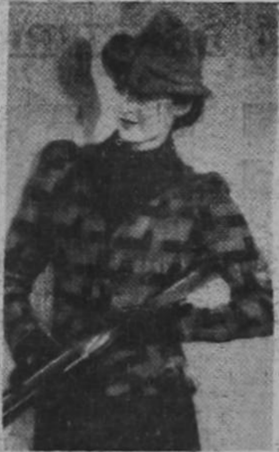
Un conjunto de caza con falda verde y chaqueta del mismo tono. Creación Marie Perier.