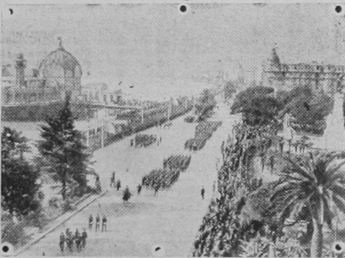
La revista anual militar que se celebra en Niza después de las fiestas de la primavera ha revestido este año una importancia singular. El desfile por el paseo de los ingleses Teléfrance 8.3.38