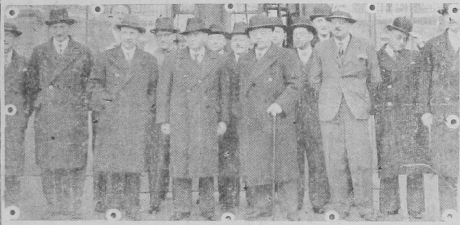
El Premier Daladier y el actual gabinete de Francia. En el centro aparece Daladier, el político destacado en la actualidad política de Francia.

CIUDAD DE MEXICO, 20. UP.— El corresponsal del rotativo "El Universal" de la ciudad de Puebla, informó hoy que en la zona militar de Atlixo algunas unidades de la defensa rural pertenecientes a las poblaciones de Tezontempan y Organal asaltaron las tierras comunales en la vecindad de Las Petacas, donde los agrarios, apoyados