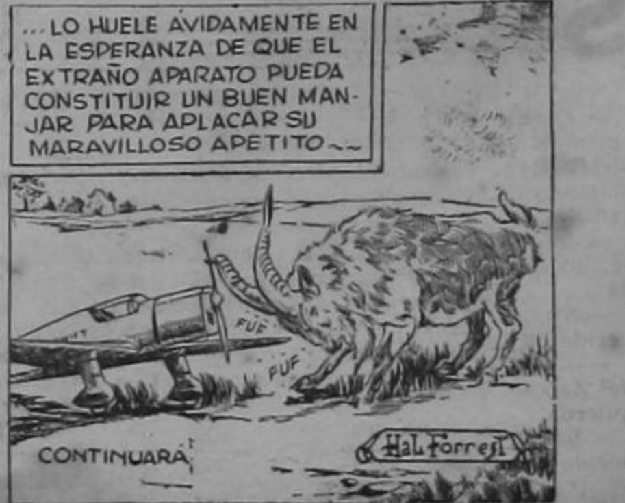
... LO HUELE AVIDAMENTE EN LA ESPERANZA DE QUE EL EXTRAÑO APARATO PUEDA CONSTITUIR UN BUEN MANJAR PARA APLACAR SU MARAVILLOSO APETITO