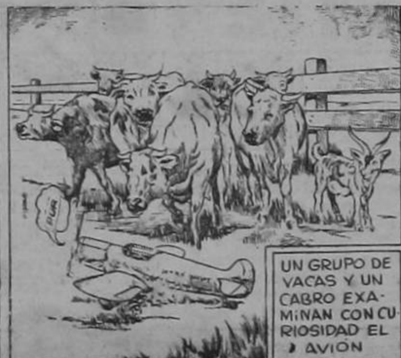
UN GRUPO DE VACAS Y UN CABRO EXAMINAN CON CURIOSIDAD EL AVION

AGOTADO SU COMBUSTIBLE, EL MODELO DE AVION HACE UN ATERRIZAJE PERFECTO EN UN PASTO. TOMÁS YAQUILES Y DITTO Y SERGMO SK CORREN A UN TIEMPO A APODERARSE DE EL