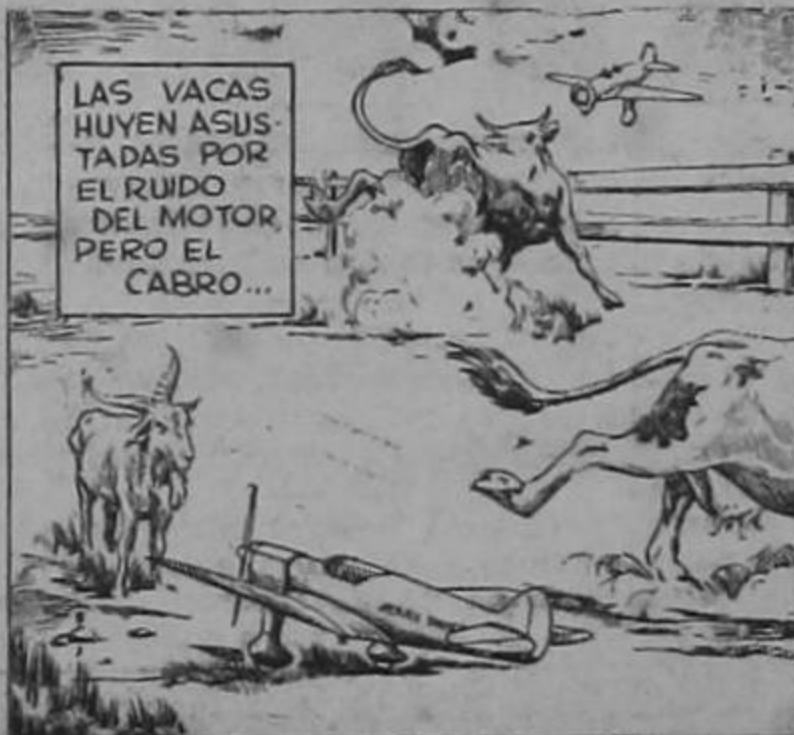
LAS VACAS HUYEN ASUSTADAS POR EL RUIDO DEL MOTOR, PERO EL CABRO...