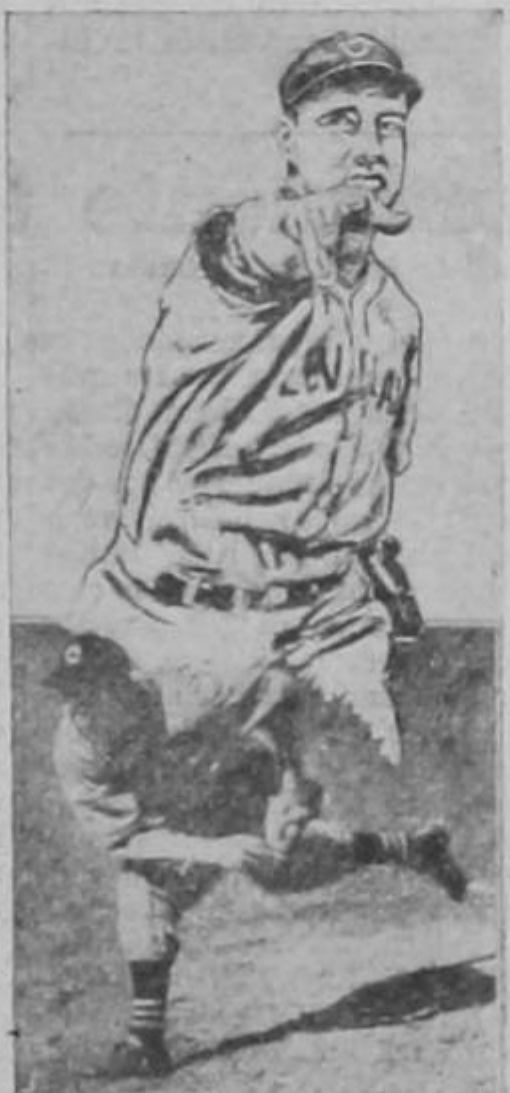
"Bob Feller, el "pitcher"-niño, es la sensación del "base ball". El niño prodigio, Bob Feller, maravilla del año en el base ball americano en acción durante su sorprendente jornada en Nueva York.

LAS CURVAS DE FELLER Y LA TRAGEDIA DE "LEFTY" GOMEZ