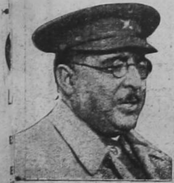
ARANDA, las tropas se hallan a 5 kms. de Lucena del Cid

También el fuerte aguacero hizo daños en varios sembrados de esa zona estimándose que ha sido este el tornado más fuerte que en los últimos años ha azotado esos distritos