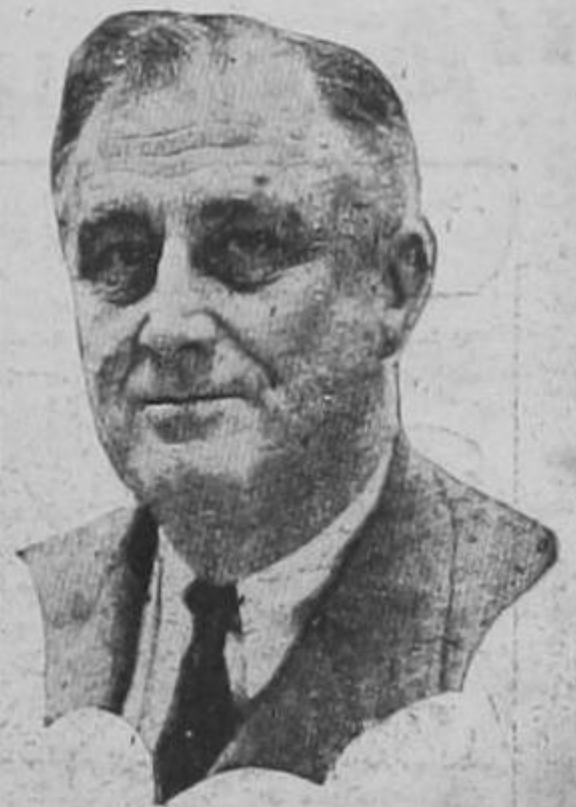
ROOSEVELT quien obtuvo un brillante triunfo en el Senado