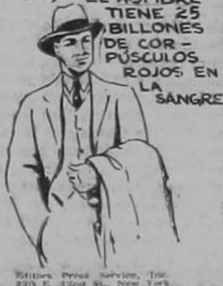
Editors: Press Service, Inc. 220 E. 42nd St., New York