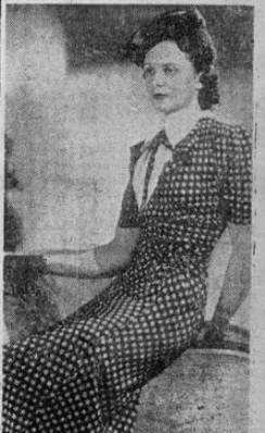
La Moda en París. Vestido de tarde en crepé de China, fondo negro con flores azul rey. Nudo en organdie blanco. Es una creación de la casa Jean Dessès de París