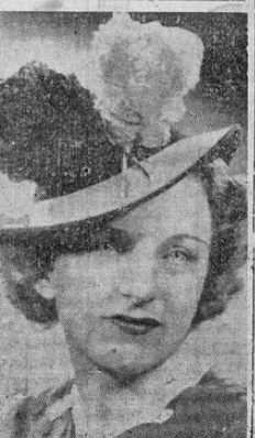
La Moda en París. "Mademoiselle Hortense" fieltro canario adornado con plumas de avestruz marrón. Creación Enely-Sœurs de París

No fué poca la desilusión de todos cuando el abogado anunció que serían otros los medios de prueba que usaría. Se habían confeccionado modelos exactos, con certificado ortométrico, de los muslos, brazos y piernas de Connie y allí fueron presentados.