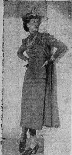
La Moda en París. Esemble en tres piezas crepé romano. Es una creación de la casa Maggy Rougg, de París