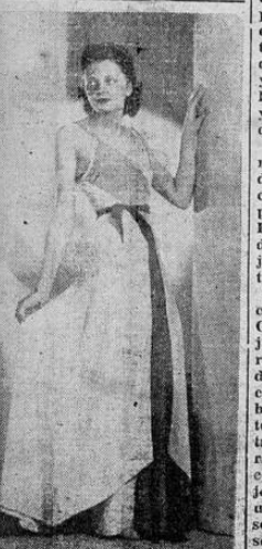
La Moda en París. Vestido de noche en crepé romano de tonos azules con adornos rojo granate. Creación Jean Dessès de París