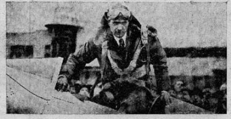
El famoso aviador Howard Hughes en la cabina de su avión, en el que va batiendo el récord en vuelo al rededor del mundo.

HASTA AHORA HUGHES HA RECORRIDO 8.839 MILLAS DESDE NUEVA YORK, EN 57 HORAS, 48 MINUTOS — EN EL TRAYECTO DE ANADIRSK A NOME SE SEÑALA MAL TIEMPO