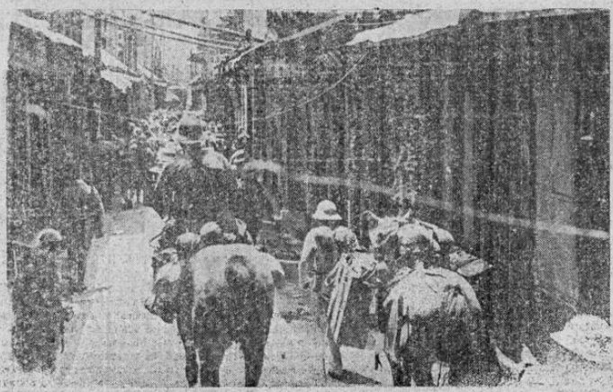
Tras de fieras batallas con los defensores chinos, los japoneses logran entrar en Hsuehchow, población que encontraron completamente deierta, como se puede ver en la fotografía.