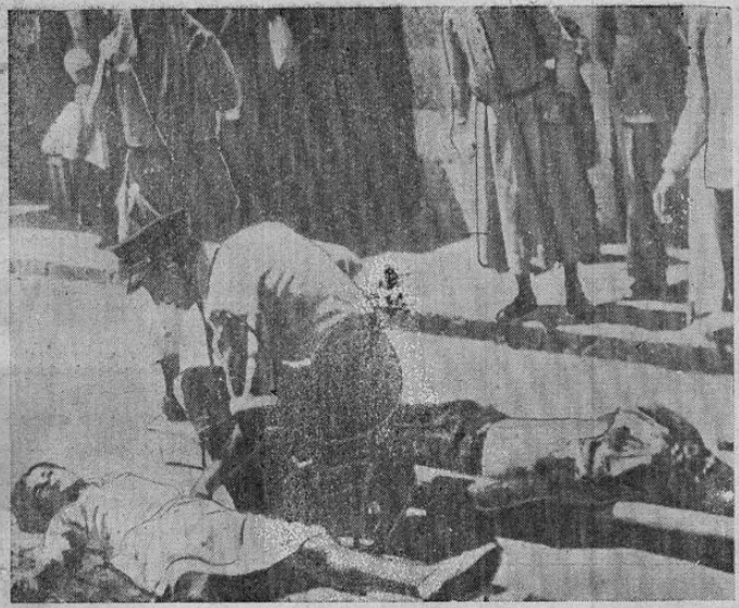
La foto muestra a la policía de Jerusalem poco después de uno de los bombardeos que tuvieron por escenario la Plaza del Mercado de dicha ciudad santa, durante la ola de terrorismo que ha invadido a la Palestina recientemente 15 árabes fueron muertos y 45 heridos al explotar una bomba en dicha plaza.

ZURICH, Suiza, 19. UP.—El duque de Alba y Berwick, representante del gobierno nacionalista español en Londres, llegaron ayer a St. Moritz donde permanecerá durante algún tiempo en goce de vacaciones. Los servicios de prensa nacionalista en Londres desmintieron hoy el rumor de que el duque de Alba tenía intención de verse con el premier Juan Negrin del gobierno de Barcelona quien llegó a Zurich esta mañana para asistir al congreso fisiológico que se encuentra en la actualidad. Los mensajes de prensa nacionalistas negar categoricamente la especie de que el duque de Alba tenía una misión oficial en su viaje, calificando los rumores en este sentido como "absurdos". El comunicado agrega que el duque de Alba y el conde de San Juan de los Rios, en razón de su salud, y al salir de Londres, el representante del general Franco no tenía ningún conocimiento de que el jefe del gobierno... —Pasa a la pág. 8