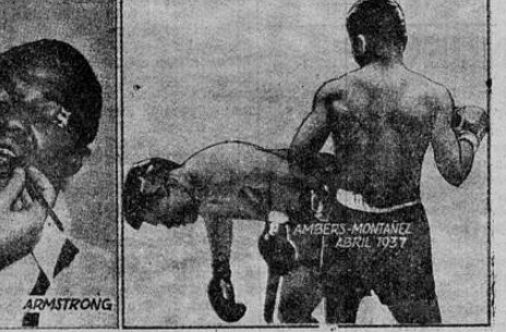
La foto a la izquierda muestra al "conquistador de tres coronas" de las ocho del boxeo bajo la mano de un cirujano después del terrible castigo que recibió a manos de Ambers su encuentro del miércoles 17 de agosto en Nueva York. La foto de la derecha es del primer encuentro de Abril de 1937, en que Montañez venció a Ambers, que aparece envuelto en la lona por un puñetazo de Montañez

bers se hubiera acostado en la lona. Pero Ambers procedió en esta ocasión en la forma contraria a como lo hizo en su primer "match" contra el portorriqueño. Después de la pelea del miércoles 17, Lou ha proclamado a los vientos que Montañez pega más fuerte que Armstrong, y ello justifica su acción. Porque fué lo cierto que después de ser derribado en el primer "match" que sostuvo con el horca en abril del año pasado, no volvió a "ponerse fresco" — como lo hizo con Armstrong — ni en el único encuentro que perdió a las manos de Pedro, ni en el siguiente en que lo aventajó a los puntos.