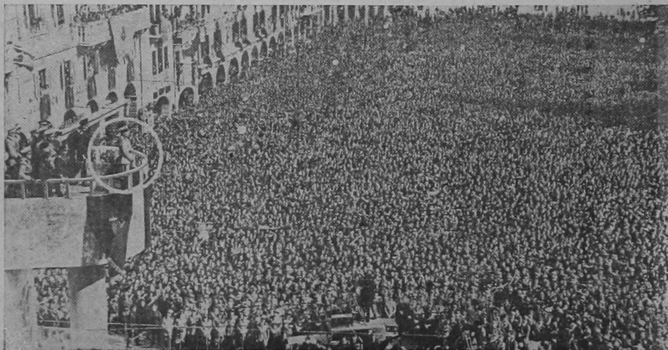
El jefe del gabinete de Italia hablando a la multitud desde un balcón de Verona, antes de partir para la histórica conferencia de Munich. En este discurso el Duce advertía a Europa que la paz dependía de la aceptación por Checoslovaquia de las demandas alemanas.