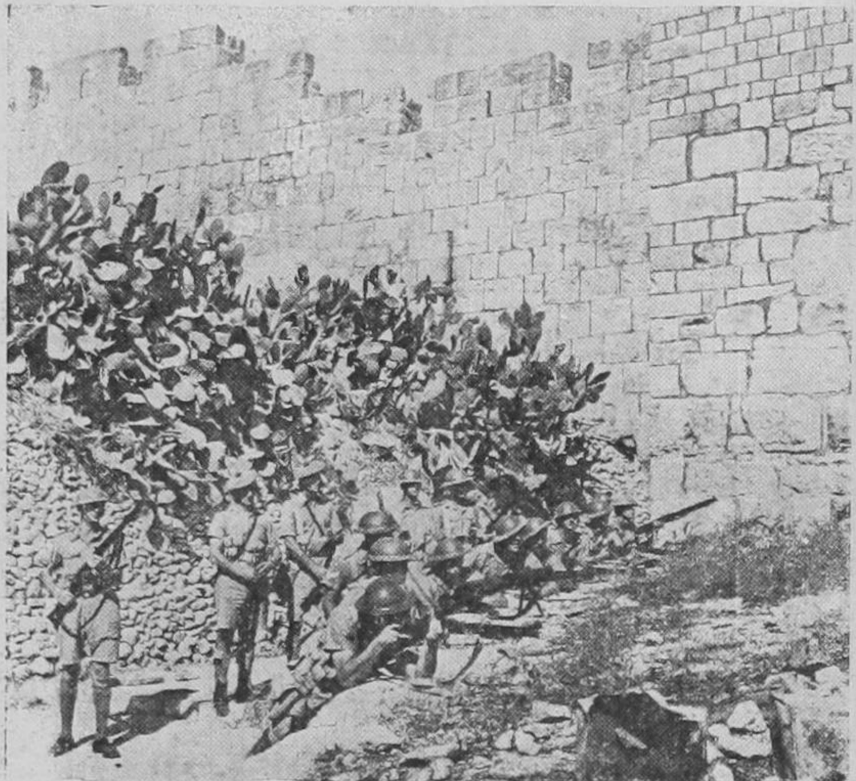
Soldados ingleses en una posición protegida fuera de los muros de Jerusalén, vigilan constantemente, en previsión de nuevos tumultos.

HELSINGFORS, 22 UP.—El gobierno fino disolvió hoy al partido fascista fino, el cual contaba con unos 50 mil miembros aproximadamente. Existía desde el año 1932 y mantenía relaciones con los nazistas y fascistas de Alemania e Italia respectivamente. El partido tenía catorce diputados en la dieta, y libra una ruda campaña en contra del gobierno democrático de la nación.