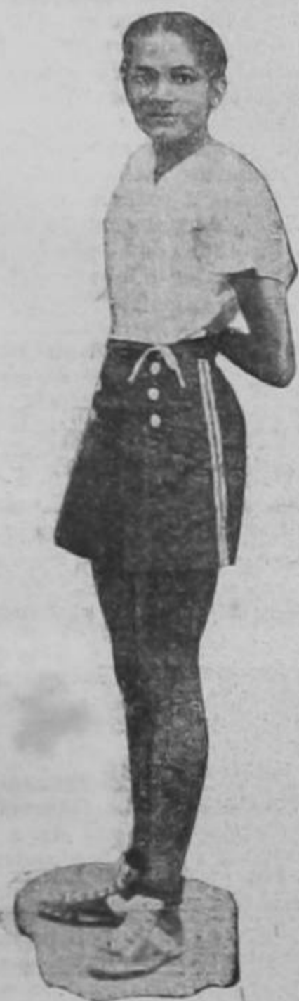
LA REINA DEL PIVOT, (AVIS)

deración Nacional de Futbol, en forma de que no existía ningún convenio entre estas dos partes, que los encuentros de segundas y demás categorías se llevarán a cabo dentro del Estadio como preliminar a los matches de primeras, en tanto que no se dejarán de verificar los encuentros de baseball por esta razón. Así las cosas, la directiva de la Federación tratará de que los matches que faltan, se realicen a las tres de la tarde, con el objeto de darle la oportunidad a los infantiles que actúen también en el Estadio, toda vez que tienen mucho derecho también, pues no por ser chiquitines sus encuentros no tienen importancia. No, no es así; sus partidas tienen tanta importancia como cualquier otro campeonato; acordémonos que estos son nuestros hombres de mañana.