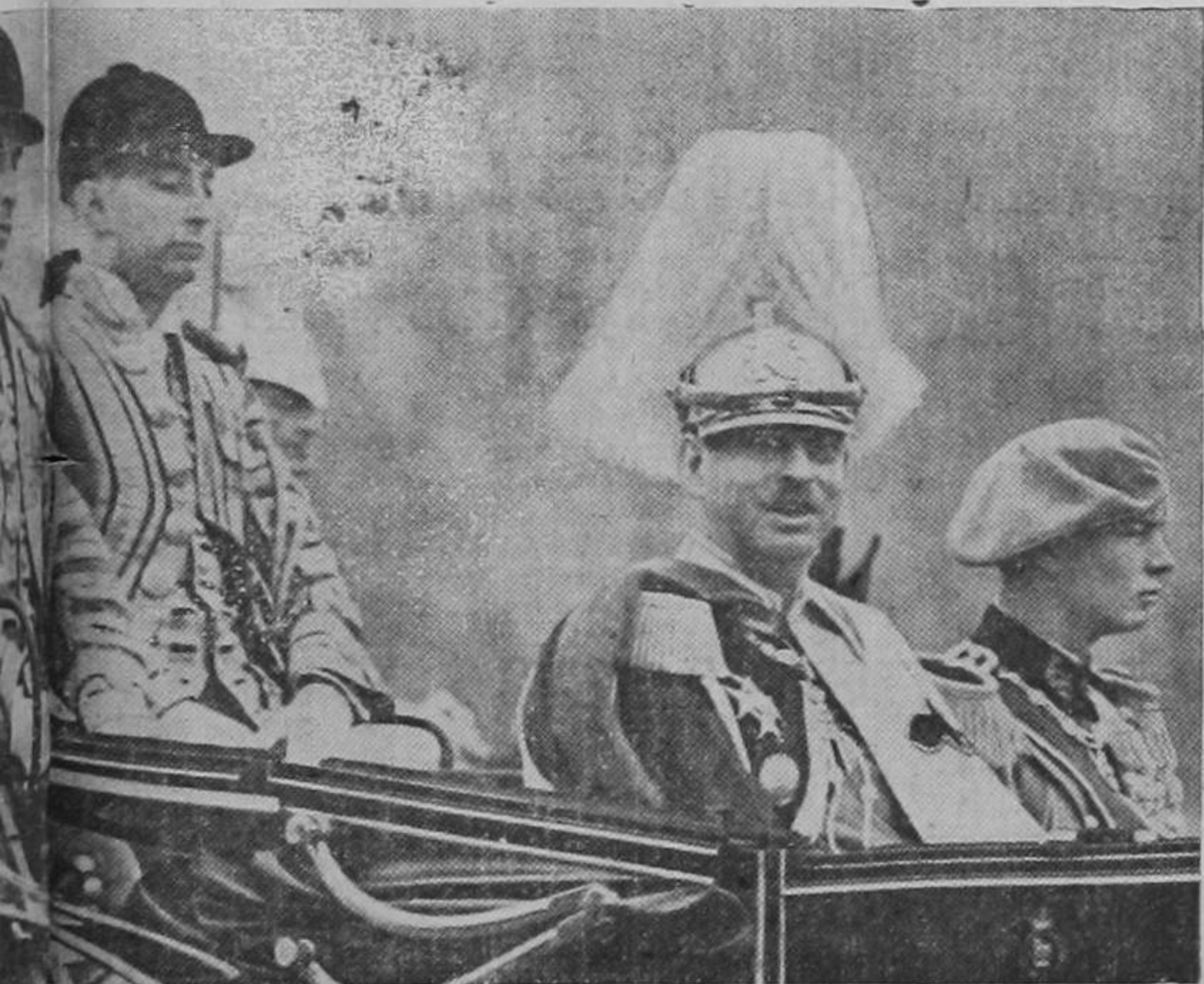
Rumanos que se encontrará en lutada con motivo de la gran catástrofe ferroviaria ocurrida hoy en el trayecto de Madrid a Londres. Vemos al monarca rumano en compañía del príncipe heredero Michael en compañía de sus familiares. Los señores iban al regio almuerzo ofrecido a ellos por el alcalde de Londres.