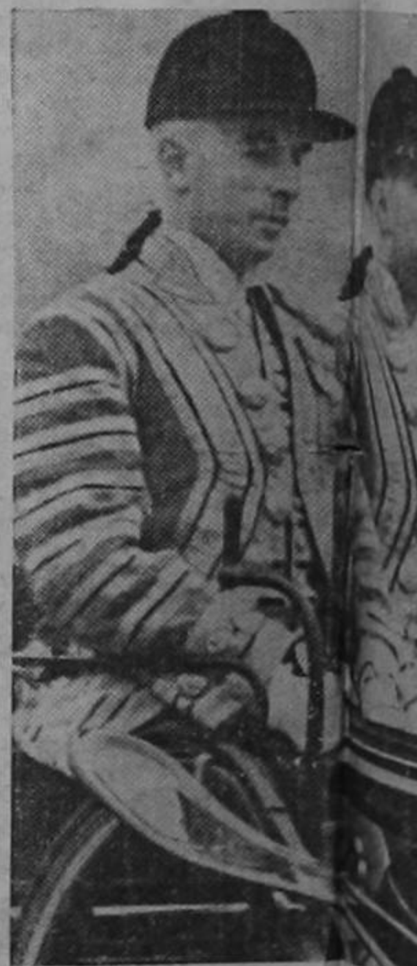
El Rey Carol II de Rumania, ayer, en su reciente visita de estado a León, el momento en que los personajes...