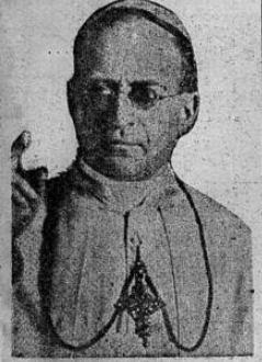
SU SANTIDAD EL PAPA PIO XI

DIJO AYER EL CONDE CIANO A LORD HALIFAX Y ESAS PALABRAS SE INTERPRETAN EN EL SENTIDO DE QUE NO SERA NECESARIA LA INTERVENCION DE ITALIA Y GRAN BRETAÑA EN EL CONFLICTO ESPAÑOL—