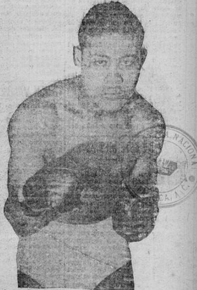
El campeón, JOE LOUIS