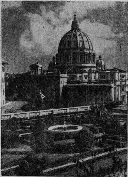
San Pedro de Roma, bajo cuya histórica cúpula habrán de celebrarse las exequias fúnebres de Su Santidad y en cuya cripta se entierran los restos mortales de los Papas.

FUERON las últimas palabras de SU SANTIDAD PIO XI antes de su MUERTE