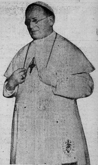
MURMURÓ PALABRAS ININTELIGIBLES

Mañana celebrará su primera reunión la Congregación de Cardenales para fijar el día en que se celebre el cónclave que elegirá al nuevo Papa.