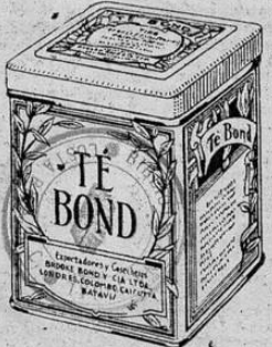
La primera marca del mundo

Teléfono 4596 — Frente al Banco Nacional — Apartado 443