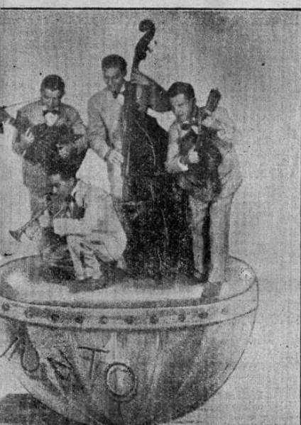
COMPOSICION FOTOGRAFICA cañaca - VENEZUELA

Paz a sus restos y que en eterna gloria descanse.