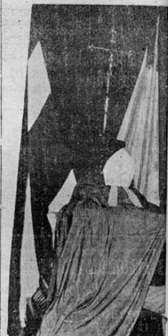
Pío XI, en la Santa Iglesia Metropolitana.

En la forma que tuvimos oca sion de adelantarlo oportunamente, se verificó a las nueve horas de hoy el solemne funeral a la venerada memoria del Santo Padre fallecido el nueve de febrero último, Su Santidad