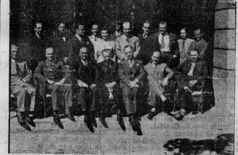
Grupo de asistentes a la importante sesión rotaria posando especialmente para LA TRIBUNA

La secretaría de educación imprimirá setenta mil manuales con disposiciones a seguir por maestros y alumnos.—Singular éxito obtiene el Club Rotario al lograr que tomara cuerpo y llegue a ser realidad una iniciativa suya