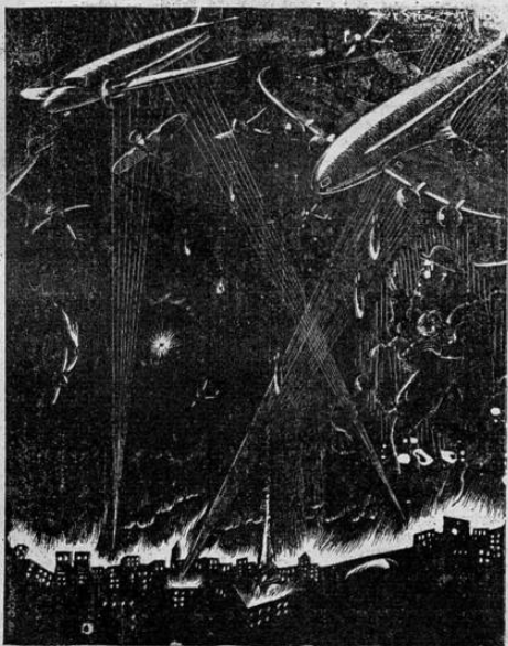
Los japoneses bombardean a Paris en el 1966. Concepción artística del dibujante Robles basada en las profecías de Nostradamus sobre el futuro de la humanidad, a que se refiere la información que publicamos en nuestra anterior edición.

Pero lo cierto es que con la suspensión decretada, están en peligro los intereses de una empresa formada por nacionales en su totalidad y que tiene a su servicio aún grupo de costarricenses, cuyos intereses y vida no puede ser indiferente. No es aventurado que en cualquier momento se les deje cesantes en sus trabajos y esto será un nuevo problema creado tan solo para complacer una demanda extraña que bien pudo haber tenido otra solución sin sacrificar tan seriamente los intereses de los costarricenses. En vez de la cancelación de la licencia de vuelo, bien pudo imponerse una multa. El daño siempre se habría producido, pero en la forma con que ahora se ha hecho, con lo que se están lesionando muchos intereses.