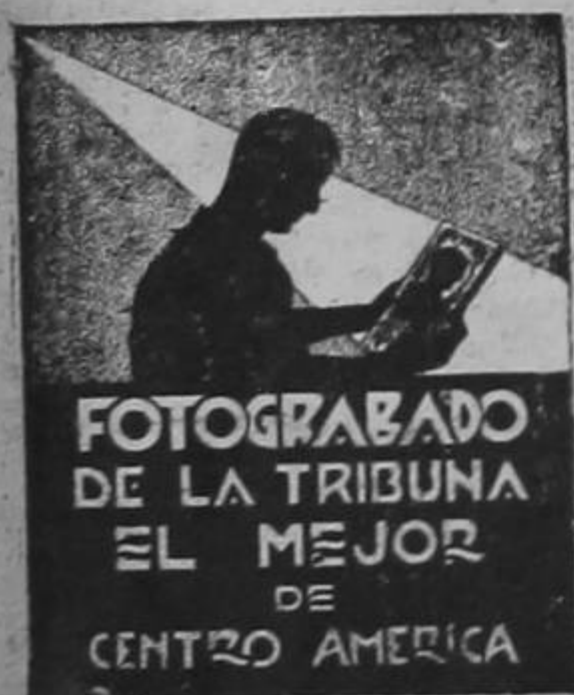
FOTOGRAFADO DE LA TRIBUNA EL MEJOR DE CENTRO AMERICA

De todas maneras siempre les queda cerca a los escolares la Escuela Maternal, pues generalmente todos ellos viven en los barrios alejados del centro de la capital.