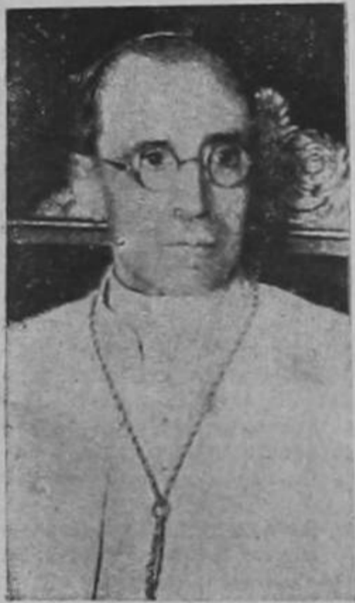
SU SANTIDAD PIO XII

Esta victoria que os concedió Dios es un heraldo para la futura tranquilidad, el orden, el honor y la prosperidad.—Aconsejó a los Obispos: "seguir los sabios principios inculcados por la Iglesia y proclamados por el Generalísimo Franco, haciendo frente al crimen con la justicia, y tratando con cariño benevolente a los que fueron engañados"