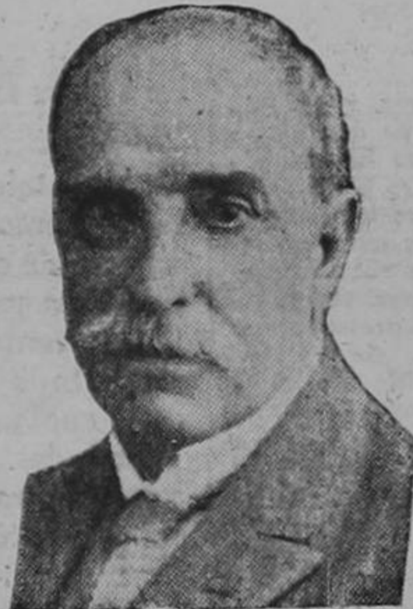
Lic. JIMÉNEZ OREAMUNO

Señor Lic. don Ricardo Jiménez. — Finca Bonilla.