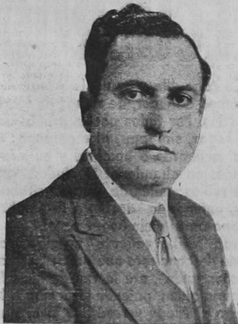
DOCTOR RAFAEL ANGEL CALDERON GUARDIA