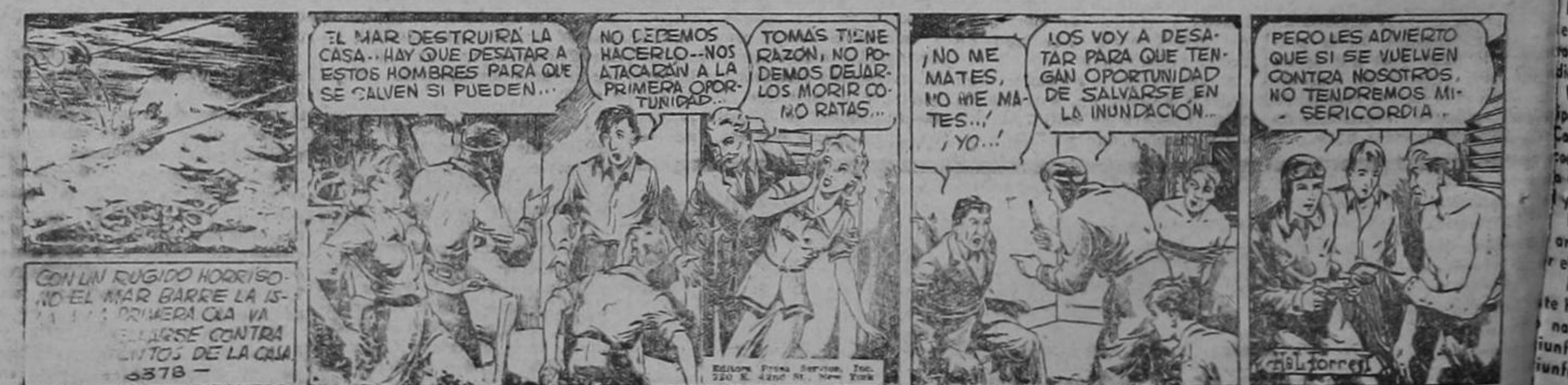
CON UN RUGIDO HORRISO... NO EL MAR BARRE LA ISLA... PRIMERA OLA VA EN CONTRA... SE ENFRENTA... SE ENFRENTA... SE ENFRENTA... 6378 -