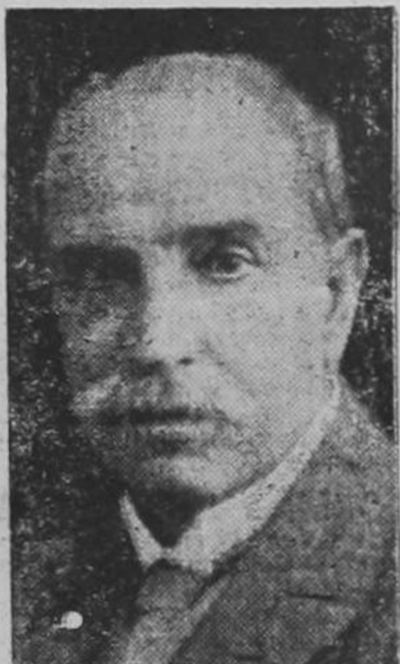
Lic. JIMENEZ O.

Fue a las seis de la mañana del domingo cuando la potente sirena de LA TRIBUNA llevó al conocimiento de la capital y luego del país por medio de las estaciones de radio la noticia que el ex-presidente de la república licenciado Jiménez Oreamuno, había resuelto renunciar la candidatura presidencial. Minutos después de haber sona