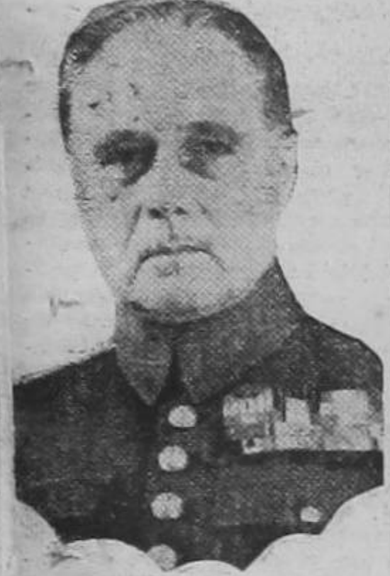
GENERAL GAMELIN Comandante supremo de las fuerzas armadas francesas

Los más bravos legionarios serán promovidos y podrán entrar al ejército regular