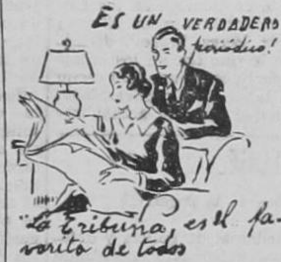
ES UN VERDADERO periodista!

Siendo "Challedon" un caballo nacido y criado en Maryland su victoria complació plenamente a los 30.000 espectadores que presenciaron la gran carrera. El vencedor del sobre estimado "Johnstown" es hijo de "Challenger II" — caballo importado de Inglaterra — y de "Laura Gal".