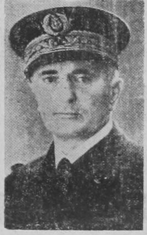
JEAN DARLAN, nombrado Almirante de Francia