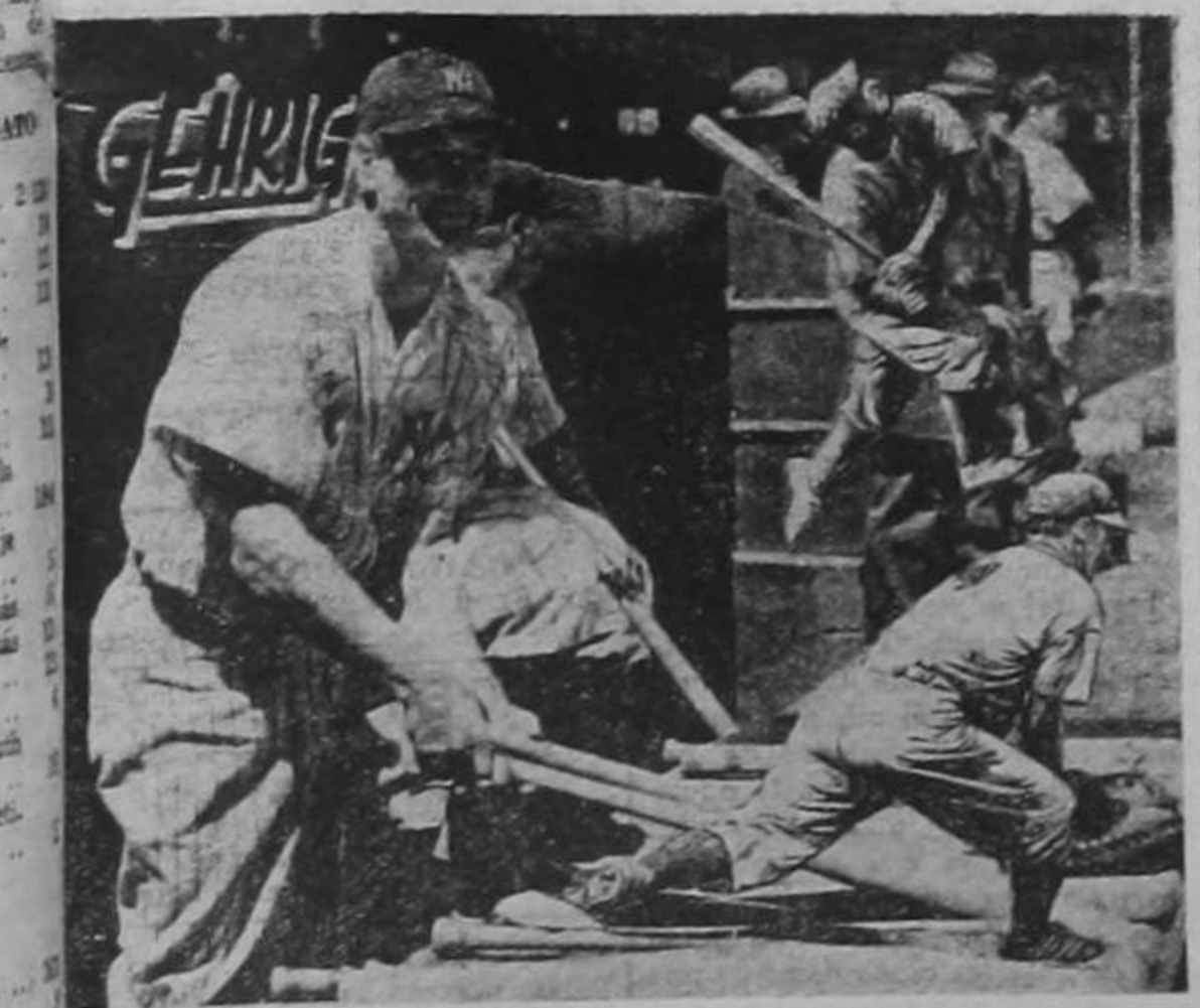
Uno de los últimos retratos de Lou Gehrig, el "hombre de hierro" del diamante, tomado después de que los médicos de la Clínica Mayo dieron su diagnóstico, el cual no le impide que soñara como de costumbre.

La "Parte Buena" de la enfermedad de Gehrig, que ha impedido que la dolorosa decadencia de los atletas se ponga de manifiesto en su caso. Los records que deja una de las figuras más conspicuas que ha nacido el base-ball