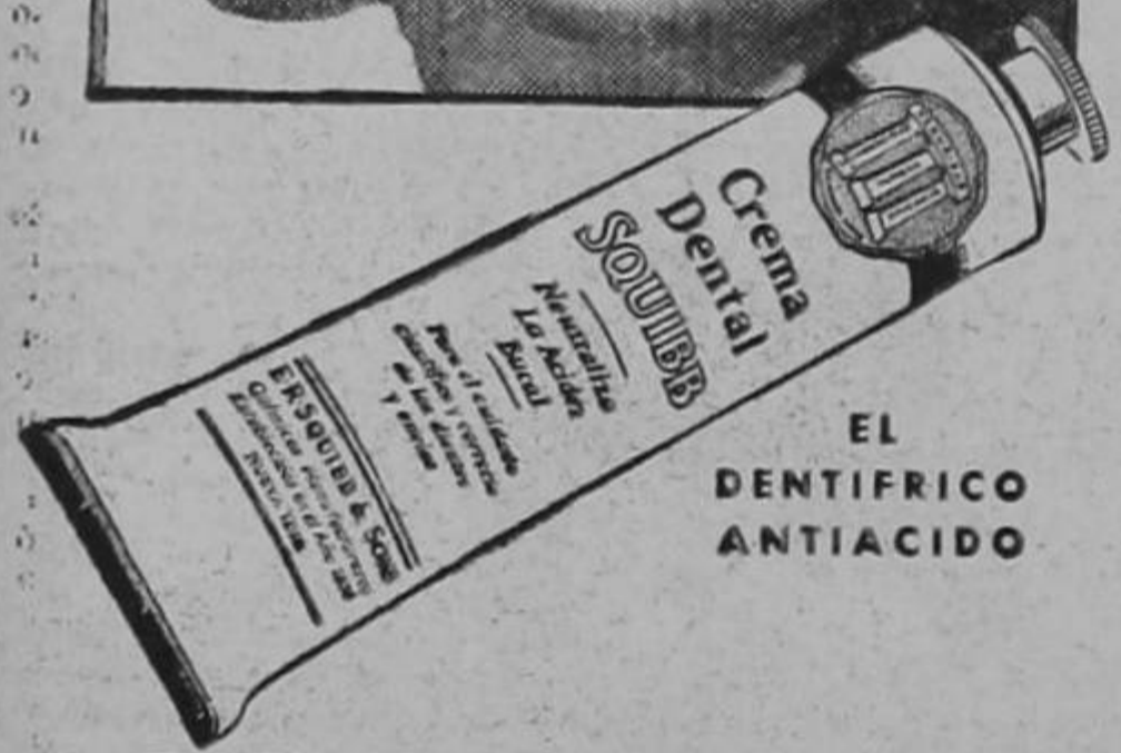
EL DENTIFRICO ANTIACIDO

En todas las bocas puede estar oculto un enemigo de los dientes y la salud. Los ácidos que se pueden formar al fermentarse las partículas de alimento que el cepillo no limpia, con frecuencia afectan las encías y causan caries. Combátalos continua y científicamente con Crema Dental Squibb. Es antiácida y al entrar en contacto con los ácidos, los neutraliza. No puede afectar la boca más delicada. Es pura, agradable, económica.